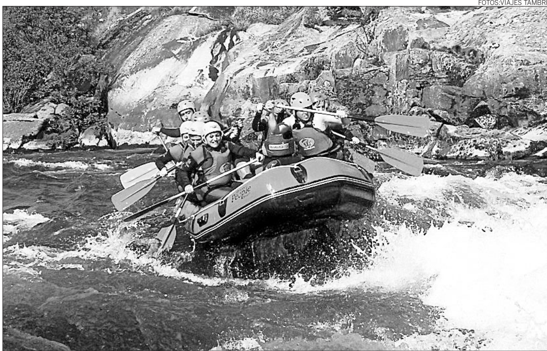
Rafting en el río Ulla. Un grupo de jóvenes entrando en un rápido, ésta es una de las posibilidades que ofrece Viajes Tambre para estas vacaciones. La actividad de rafting está programada tanto para julio como para agosto y tiene un precio de 30 euros, en los que se incluye todo lo necesario para la aventura

Las aventuras están supervisadas por monitores especializados. Para realizarlas, no es necesario tener conocimientos del medio ni de técnicas, ya que están pensadas para gente que nunca las practicó. Los precios oscilan entre los 30 y 40 euros. Viajes Tambre espera que sus propuestas estivales reciban el éxito de convocatoria de años anteriores en lo que a este tipo de actividades se refiere.