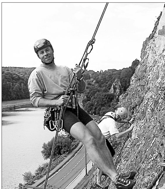
Rapell. Esta actividad se incluye dentro del raid aventura para los más osados, que tienen la posibilidad de elegir entre esta actividad o puenting